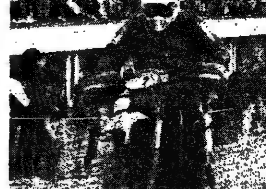
Masqué sur les dunes de la plage du Touquet, quelque cent cinquante motocyclistes ont disputé le 22 février, à la victoire du Suédois Leif Persson dans le troisième édition de l'Enduro créé par Thierry Sabina...